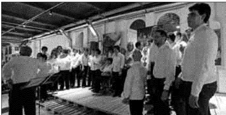
Gara di solidarietà alla Cena delle stelle per l'associazione In-Oltre